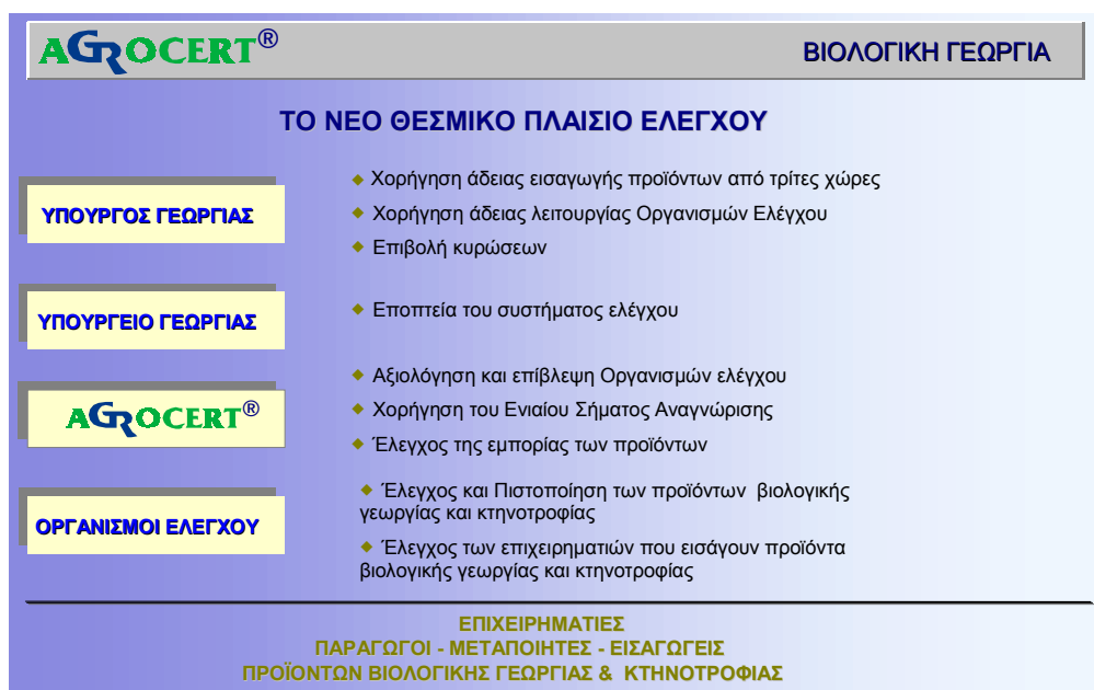
Διάγραμμα 1: Το Θεσμικό Πλαίσιο Ελέγχου και Πιστοποίησης Βιολογικών Προϊόντων 2

Με βάση αυτό το πλαίσιο, σήμερα λειτουργούν στην Ελλάδα τρεις ιδιωτικοί Οργανισμοί Ελέγχου & Πιστοποίησης Βιολογικών Προϊόντων με τις επωνυμίες «ΒΙΟΕΛΛΑΣ», ανώνυμη εταιρεία που λειτουργεί με αυτό το όνομα από το 2001, ενώ το ιστορικό της ως φορέας πιστοποίησης ξεκινά από την έγκριση της το 1993 ως «Σ.Ο.Γ.Ε.» (Σύλλογος Οικολογικής Γεωργίας Ελλάδας), «ΔΗΩ» και «Φυσιολογική», οι οποίες ασκούν τεχνικούς ελέγχους και παρέχουν πιστοποίηση στο σύνολο των Ελλήνων βιοκαλλιεργητών. Η «ΔΗΩ» αποτελεί με μεγάλη διαφορά τον σημαντικότερο